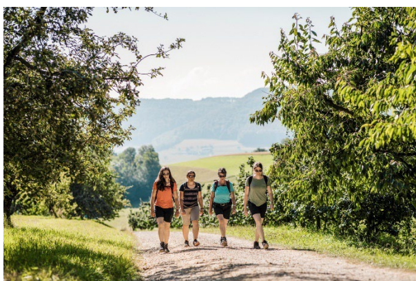
Fricktaler Höhenweg