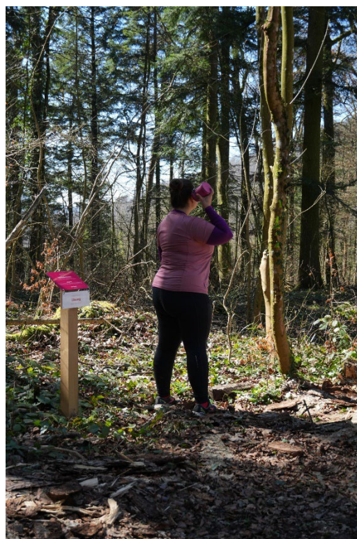
Musikweg Unteres Fricktal