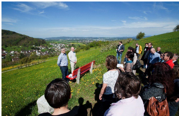
Eröffnung 2012